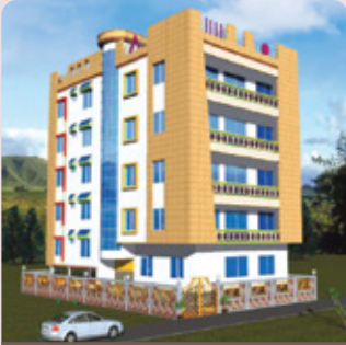
ধর্ম হোম ব্লক-ডি, রোড-৫, বাড়ী-১৫৮ শাহজালাল উপশহর, সিলেট হস্তান্তর - জুলাই ২০১৩