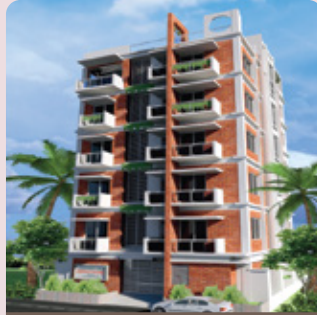
ওসমরা হোম ব্লক-এ, রোড-২, বাড়ী-৮ শাহজালাল উপশহর, সিলেট হস্তান্তর - জুন ২০১৬