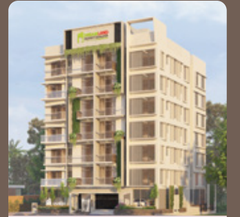
আনাকা অর্পন-৪৬ মীরের ময়দান, সিলেট