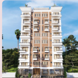
আজহার হোম বংধনু-৫২, লাকড়ীপাড়া শিবগঞ্জ, সিলেট হস্তান্তর - মে ২০২৫