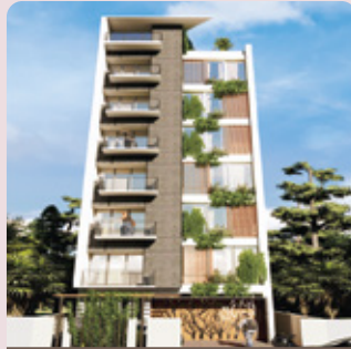
রাওদা গার্ডেন শুভেচ্ছা-১৬৮, মিয়া ফাজিল চিশত সুবিদ বাজার, সিলেট হস্তান্তর - সেপ্টেম্বর ২০২২