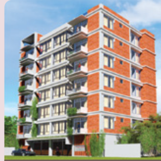
আসর হোম শুভেচ্ছা-১০০, ফাজিল চিশত আ/এ সুবিদ বাজার, সিলেট হস্তান্তর - জুন ২০১৮