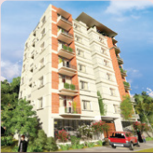
আরবা হোম শুভেচ্ছা-১০২, ফাজিল চিশত আ/এ সুবিদ বাজার, সিলেট হস্তান্তর - জুন ২০২০